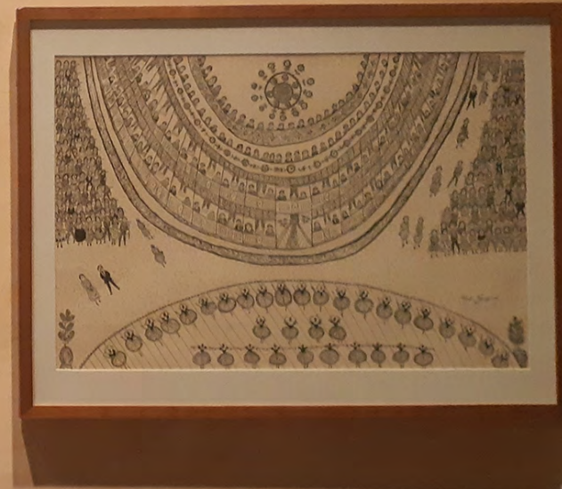
BRUNO GIL 1964 Gravura em madeira