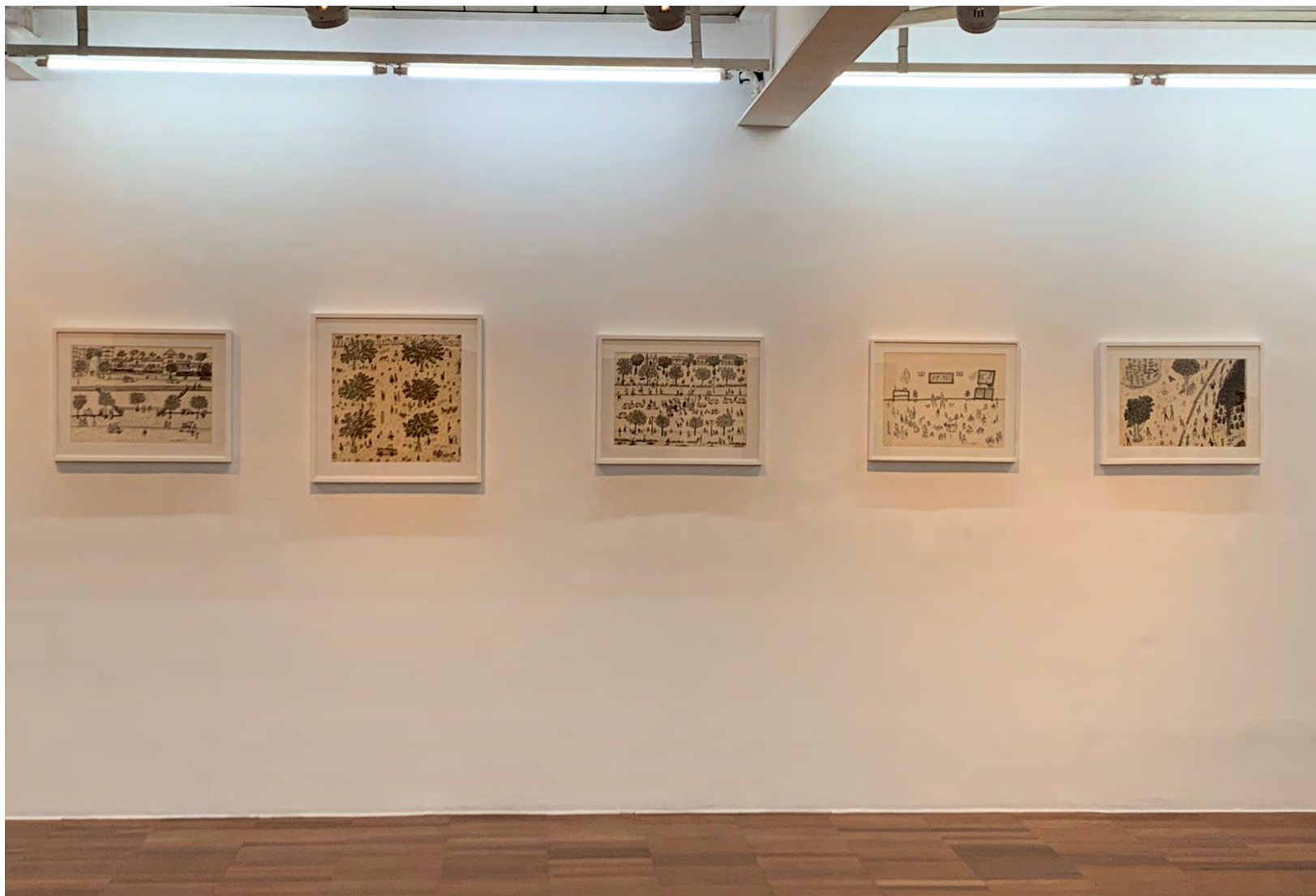
2020 Mulheres na Arte Popular, Galeria Estação, São Paulo, SP, Brasil