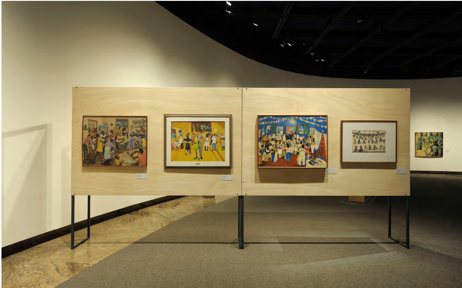
2021 Da Humanidade: 100 Artistas do Acervo, Museu de Arte Brasileira (MAB-FAAP, São Paulo, SP, Brasil)