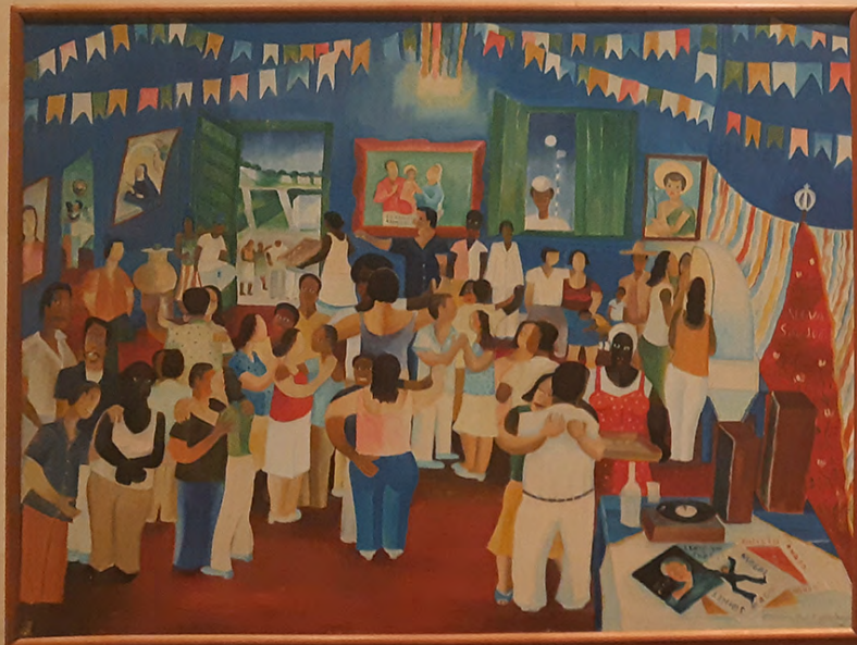
BRUNO GIL 1964 Óleo sobre tela