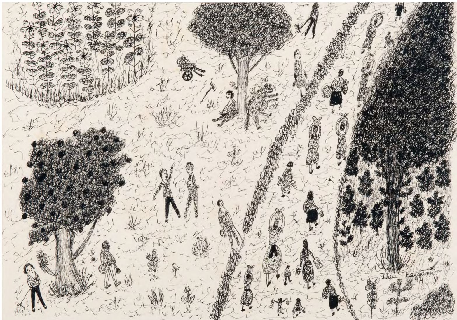
Sem título, 1994 Bico de pena sobre papel 34 x 49 cm | 13.38 x 19.29 in