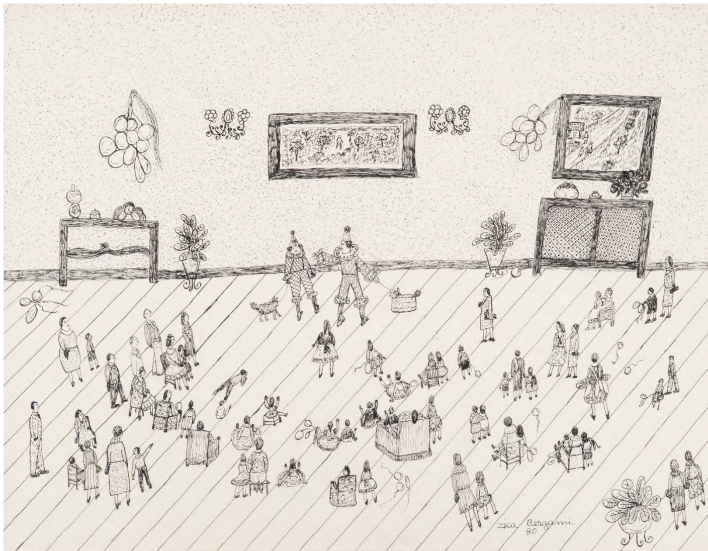
Festa com palhaço, 1980 Bico de pena sobre papel 48 x 58 cm | 18.89 x 22.83 in