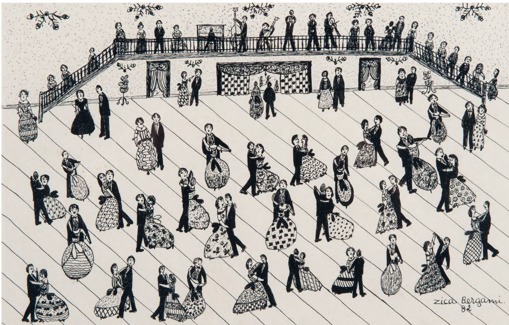
Baile, 1982 Bico de pena sobre papel 24 x 37 cm | 9.44 x 14.56 in