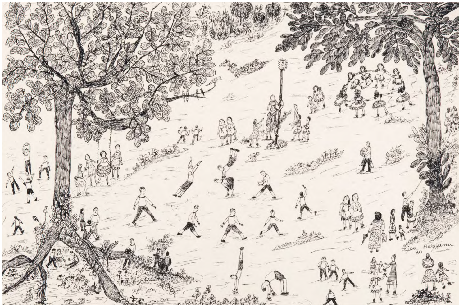
Folgedos, 1980 Bico de pena sobre papel 45 x 60 cm | 17.71 x 23.62 in