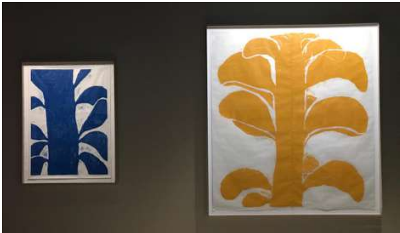
2019 Nous les Arbres, Fondation Cartier pour l'art ccontemporain, Paris, França