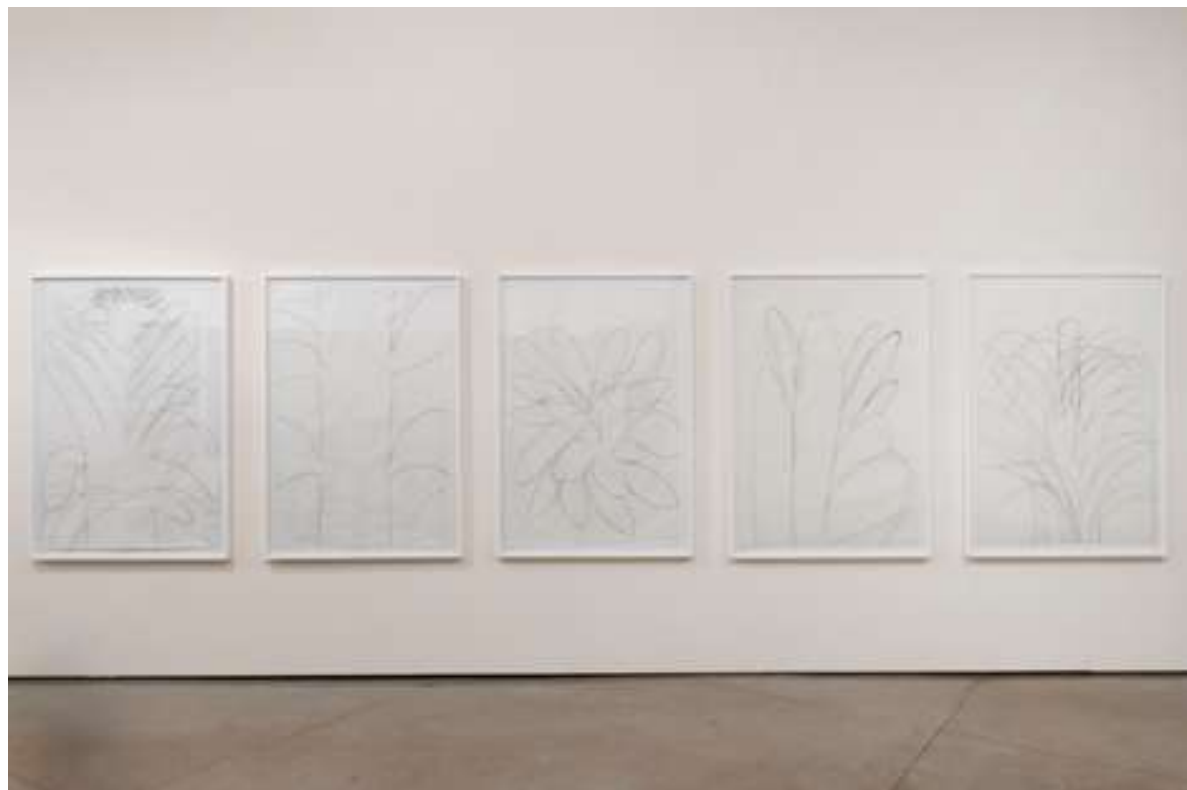
2019 36º Panorama da Arte Brasileira: sertão, MAM - São Paulo, SP, Brasil