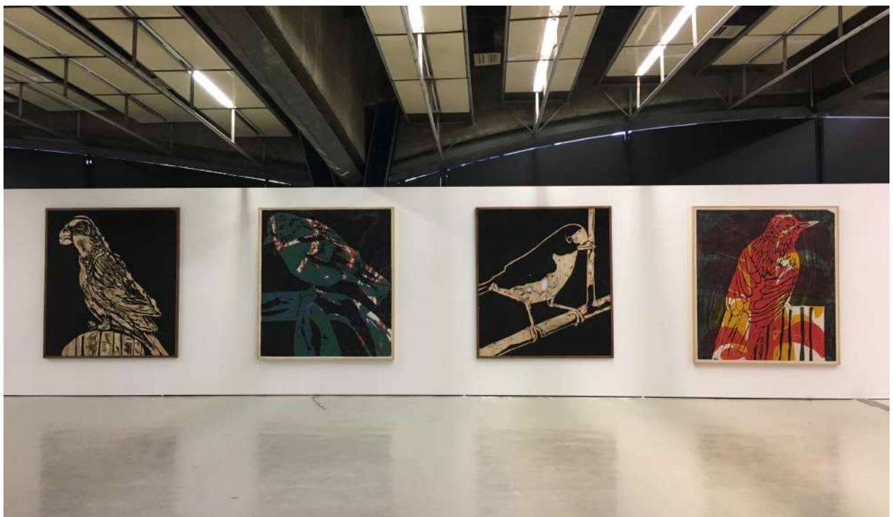
2018 O preto no branco, sobreposição e nuances, Centro Cultural São Paulo, SP, Brasil