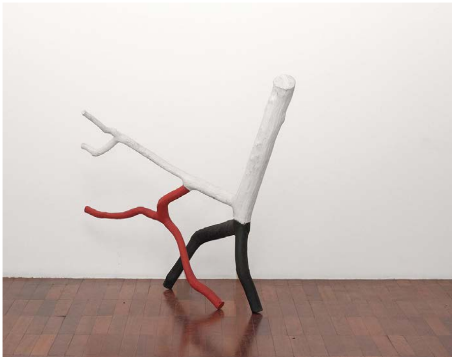
Cícero Alves dos Santos - Véio 1948, Nossa Senhora da Glória – SE

Sem título, 2012 Tinta acrílica e madeira 70 x 134 x 121 cm | 27.55 x 52.75 x 47.63 in