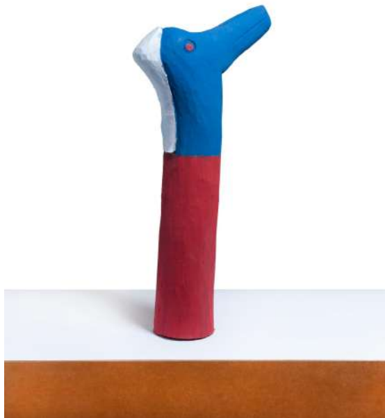
Cícero Alves dos Santos - Véio 1948, Nossa Senhora da Glória – SE

O mascarado, 2014 Tinta acrílica e madeira 80 x 40 x 13 cm | 31.49 x 15.74 x 5.11 in