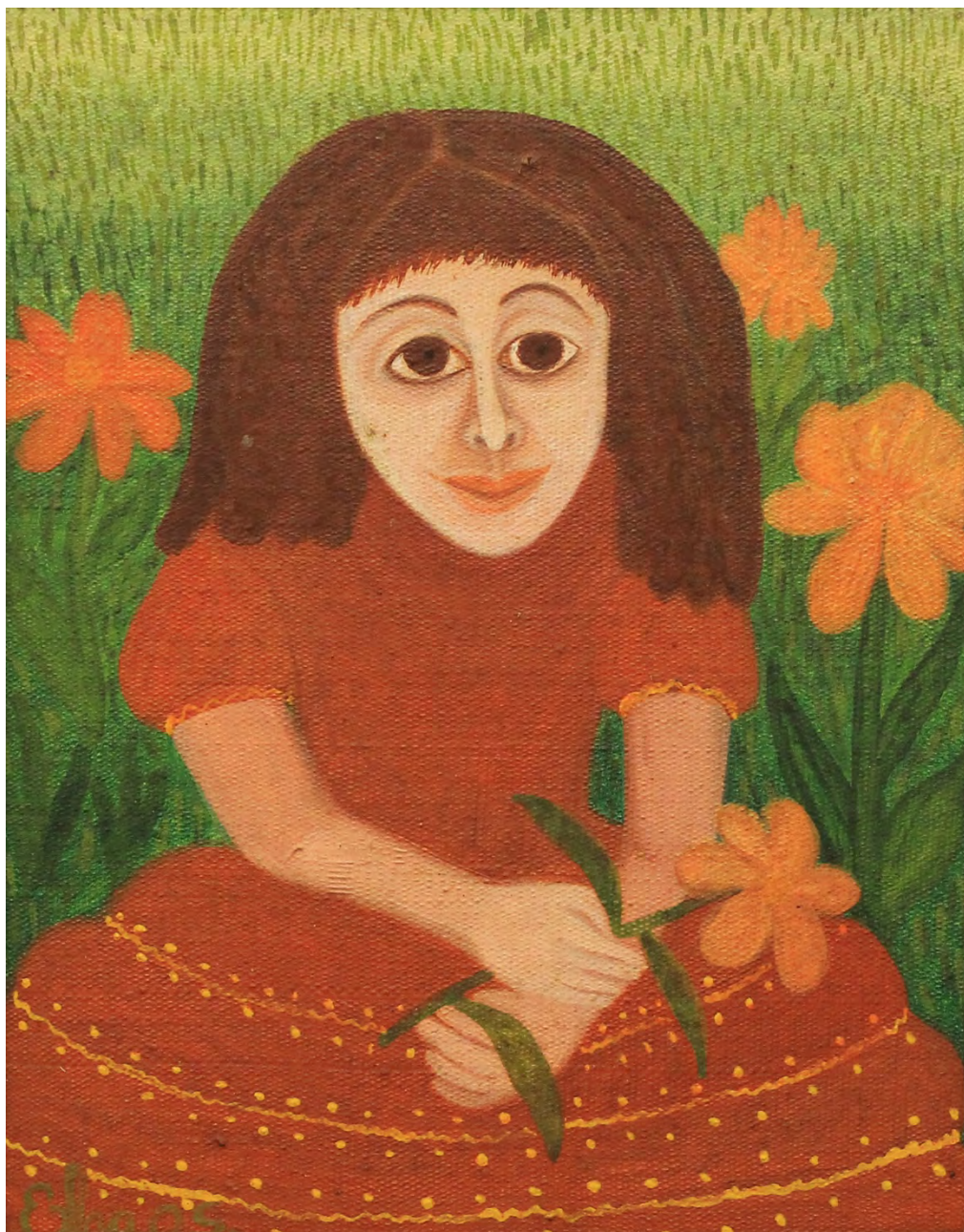
Sem título Óleo sobre tela 24 x 19 cm | 9.45 x 7.48 in