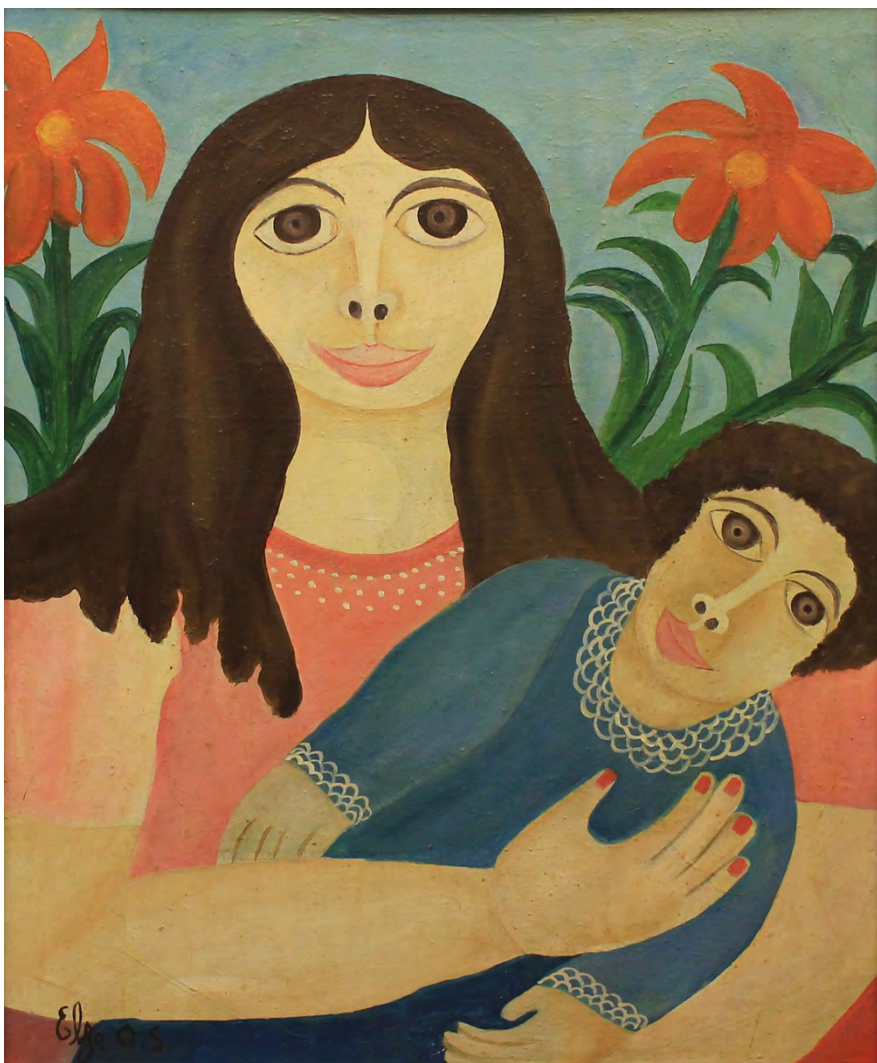
Maternidade, Óleo sobre Eucatex 61 x 50 cm | 24.02 x. 19.69 in