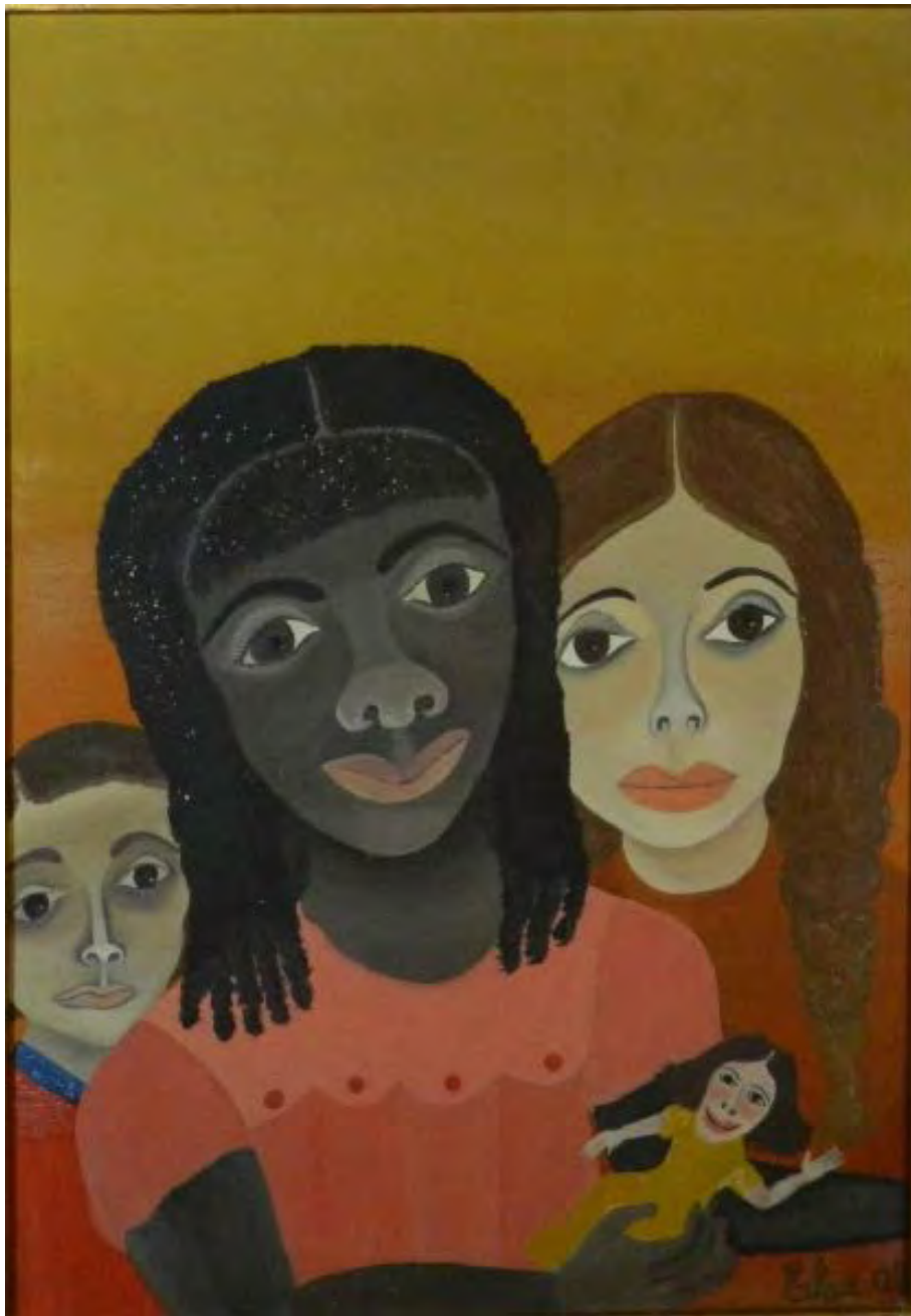
Sem título Óleo sobre tela 65 x 46 cm | 25.6 x 18.11 in