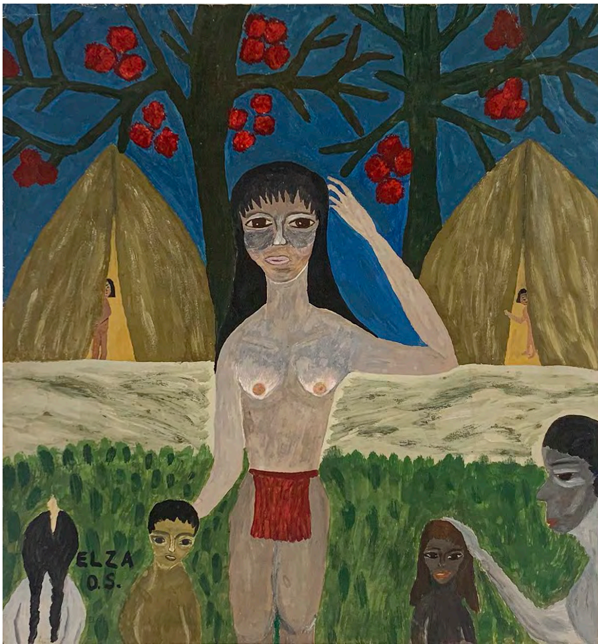
Sem título Guache sobre papel 35 x 33 cm | 13.77 x 12.99 in