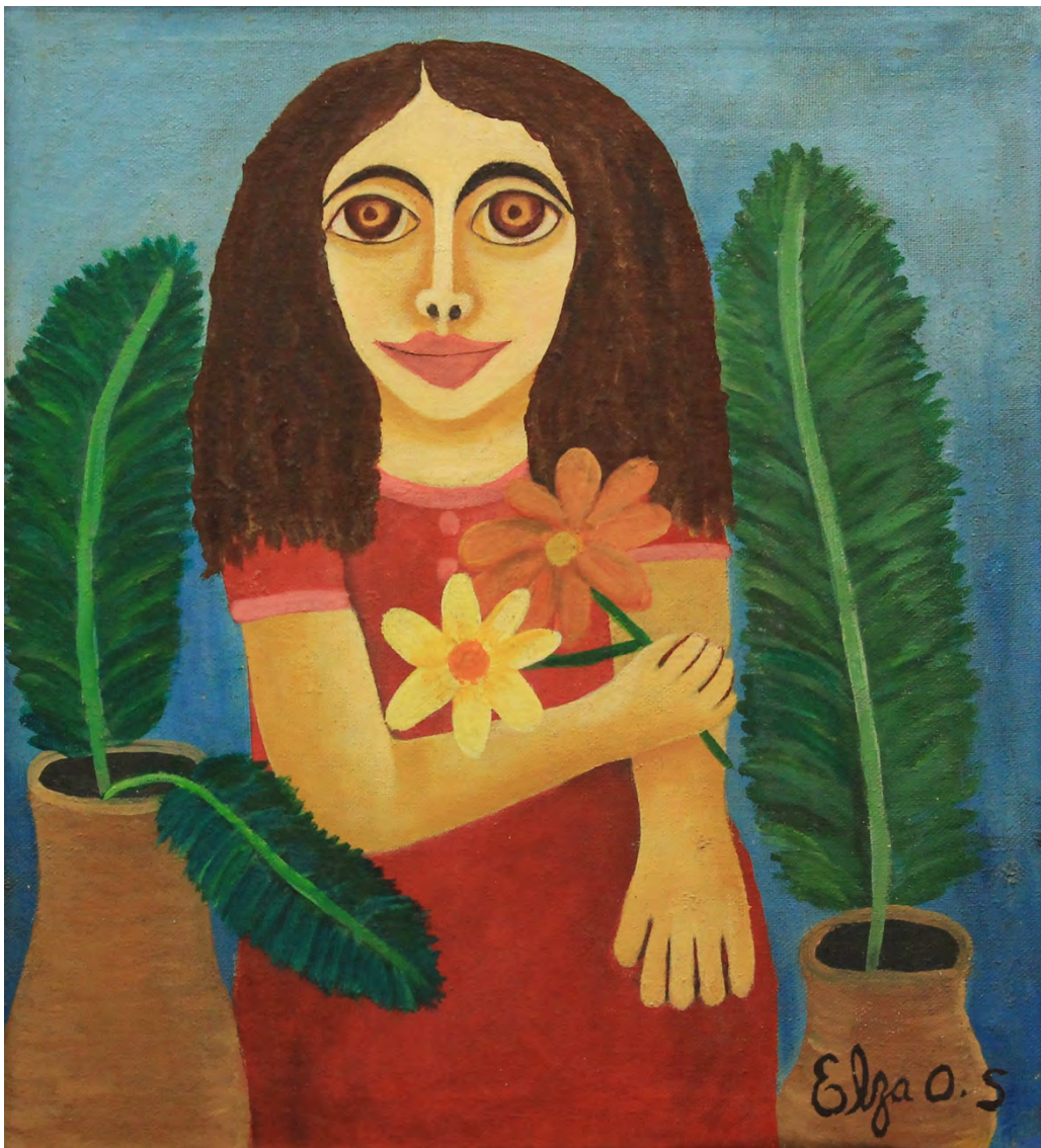
Menina com Flor, déc 70 Óleo sobre tela 34 x 31 cm | 13.39 x 12.20 in