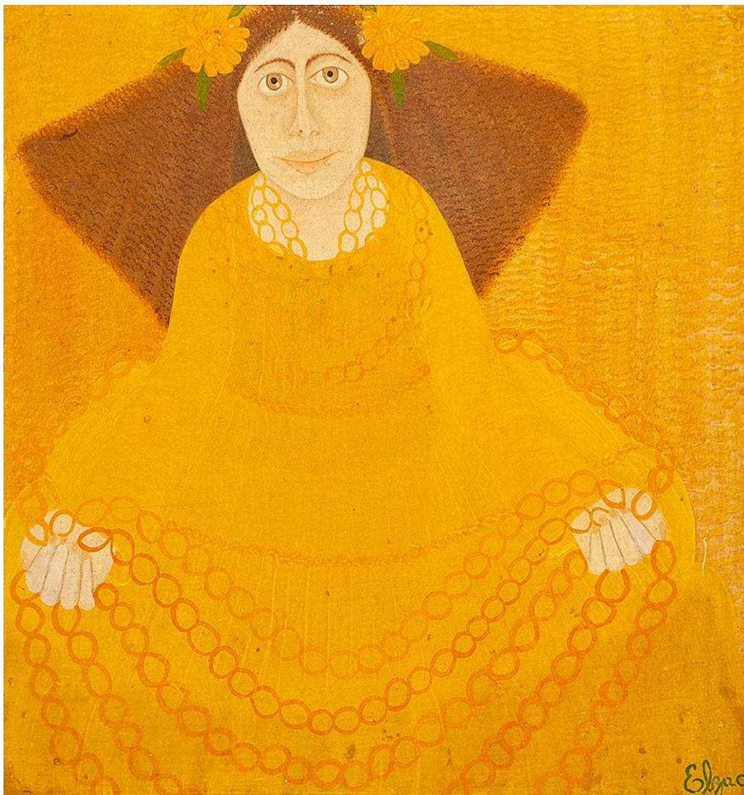
Sem título Óleo sobre eucatex 24 x 34,5 cm | 9.45 x 13.7 in