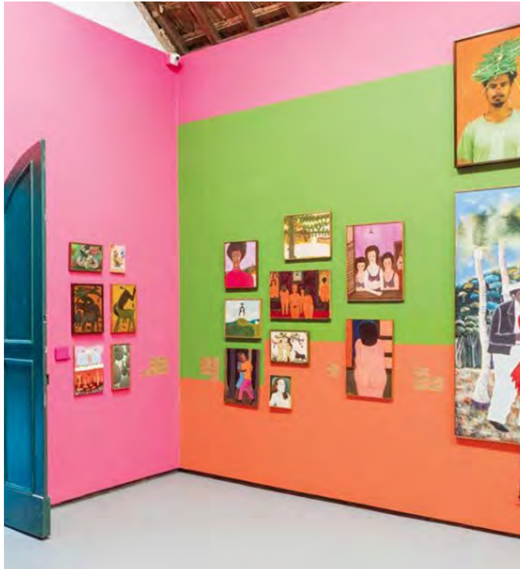
Arte Naif – Nenhum Museu a Menos, Parque Lage, Rio de Janeiro, RJ, Brasil