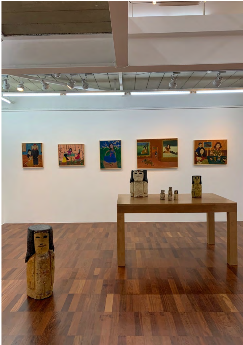
2020 Mulheres na Arte Popular, Galeira Estação, São Paulo, SP, Brasil