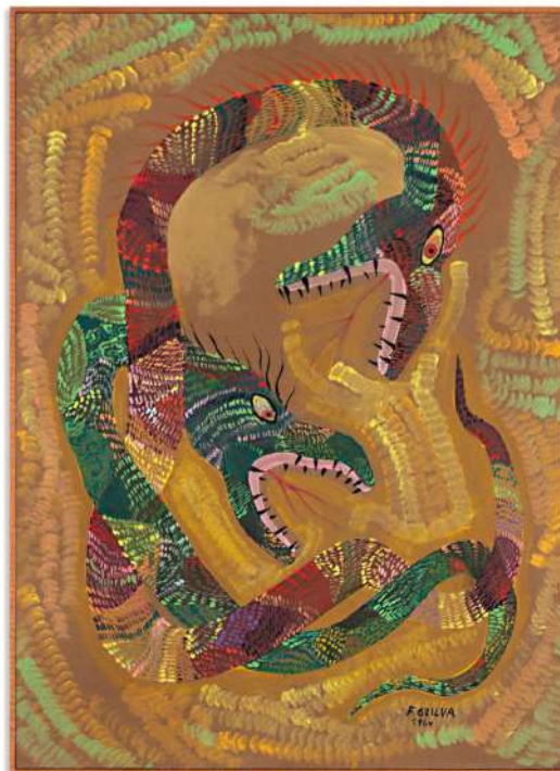
Chico da Silva - Francisco Domingos da Silva 1910-1922, Alto Tejo - AC | 1985, Fortaleza - CE

Sem título, 1964 Guache sobre papel 48,5 x 67 cm | 18.89 x 26.37 in