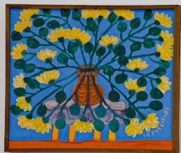
Árvore de Vida