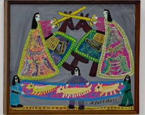
Small white label below the painting.