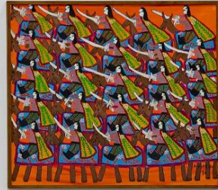
Small white label below the painting.