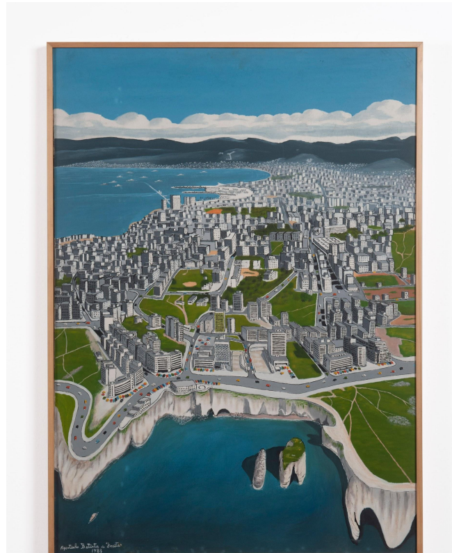
Agostinho Batista de Freitas 1927, Campinas - SP | 1997, São Paulo - SP

Pigeon Rocks - Beirute, 1983 Óleo sobre tela 100 x 70 cm | 39.37 x 27.55 in