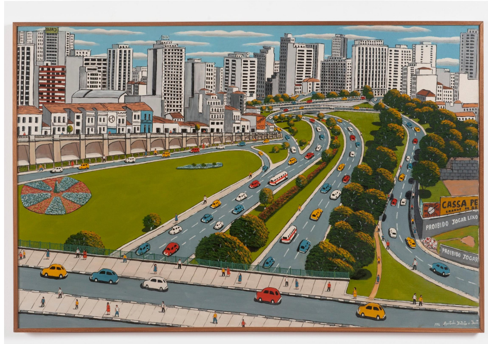
Agostinho Batista de Freitas 1927, Campinas - SP | 1997, São Paulo - SP