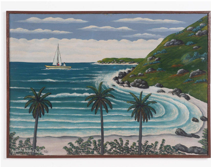
Agostinho Batista de Freitas 1927, Campinas - SP | 1997, São Paulo - SP

Sem título , 1984 Óleo sobre tela 50 x 70 cm | 19.68 x 27.55 in