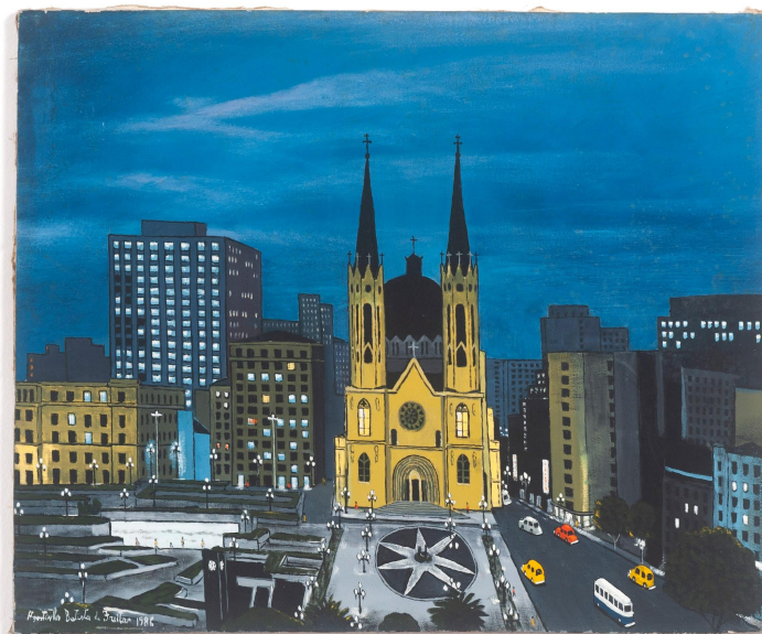
Agostinho Batista de Freitas 1927, Campinas - SP | 1997, São Paulo - SP

Praça da Sé, 1986 Óleo sobre tela 53 x 65 cm | 20.86 x 25.59 in