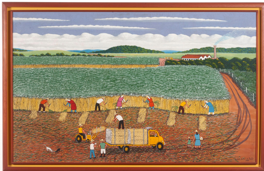
Agostinho Batista de Freitas 1927, Campinas - SP | 1997, São Paulo - SP