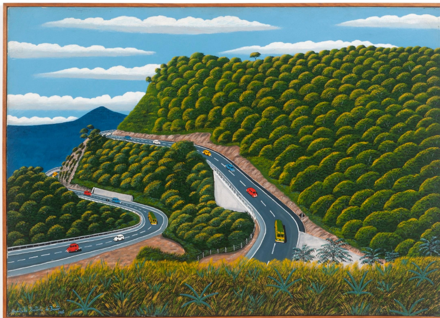
Agostinho Batista de Freitas 1927, Campinas - SP | 1997, São Paulo - SP