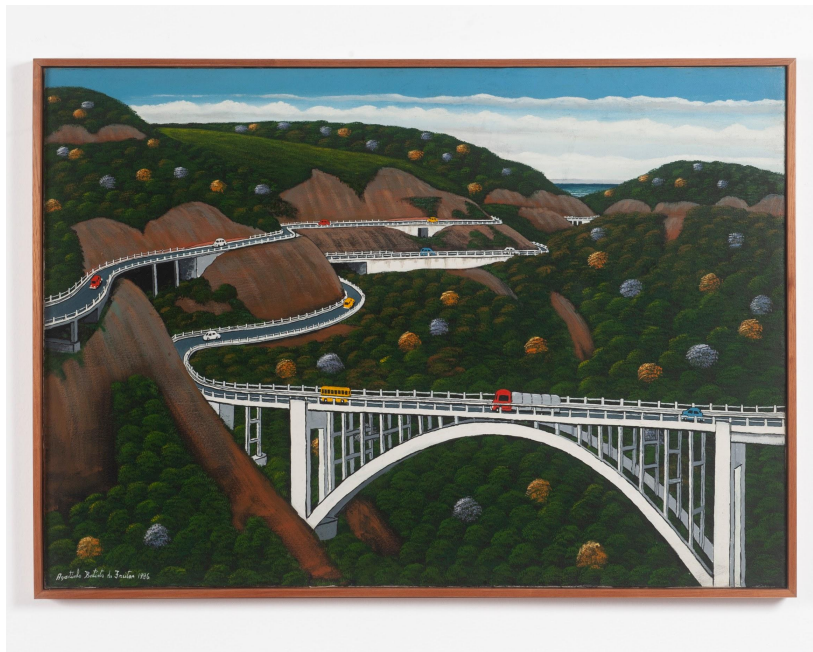
Agostinho Batista de Freitas 1927, Campinas - SP | 1997, São Paulo - SP

Imigrantes, 1986 Óleo sobre tela 70 x 100 cm | 27.55 x 39.37 in