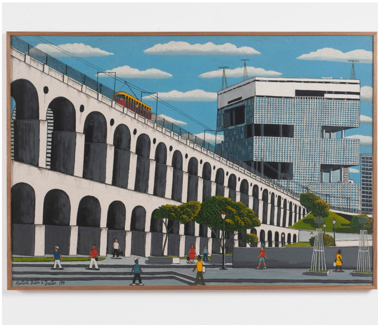
Agostinho Batista de Freitas 1927, Campinas - SP | 1997, São Paulo - SP

Arcos da Lapa, 1991 Óleo sobre tela 70 x 99 cm | 27.55 x 38.97 in