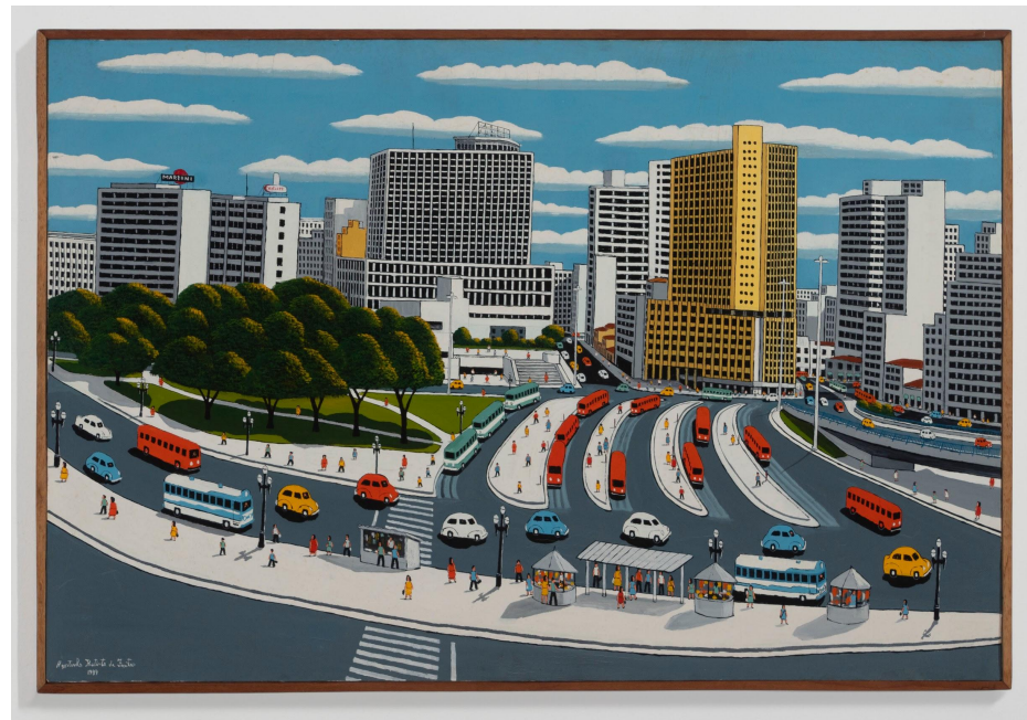
Agostinho Batista de Freitas 1927, Campinas - SP | 1997, São Paulo - SP

Praça da Bandeira, 1989 Óleo sobre tela 80 x 120 cm | 31.49 x 47.24 in