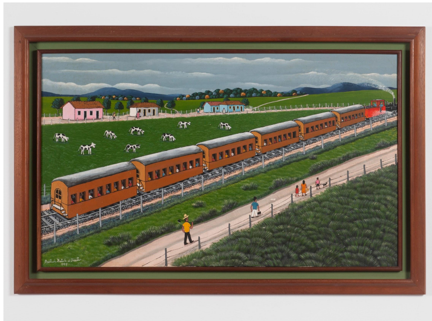
Agostinho Batista de Freitas 1927, Campinas - SP | 1997, São Paulo - SP