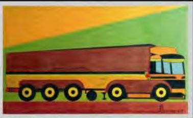
Artista/tes | Perkins | 1962-68 cm