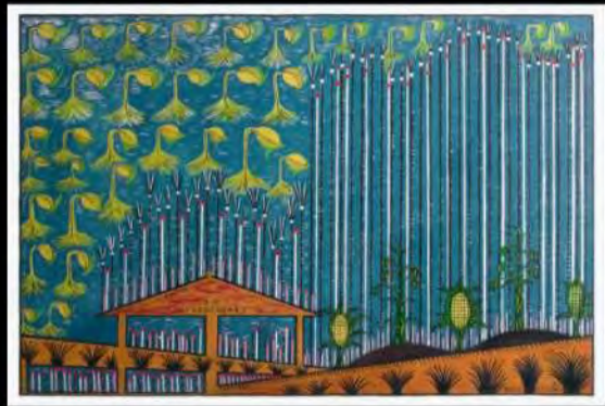
Acrílico s/ tela | As plantações | 102x192 cm