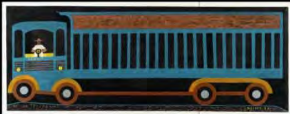
Acrylic q/ tela | Busão | 81x204 cm