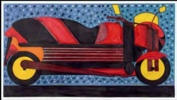
Acrílico s/ tela | Triflora | 87x154 cm