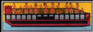
Acrylic q/ tela | Sem título | 75x227 cm