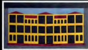
Arquitetura Brasileira | Museu de Arte Moderna do Rio de Janeiro