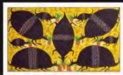
Acrílico s/ tela | Tábua | 40x54 cm