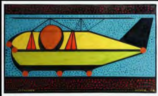
Acrílico e/ tela | Diáspora | 82x150 cm