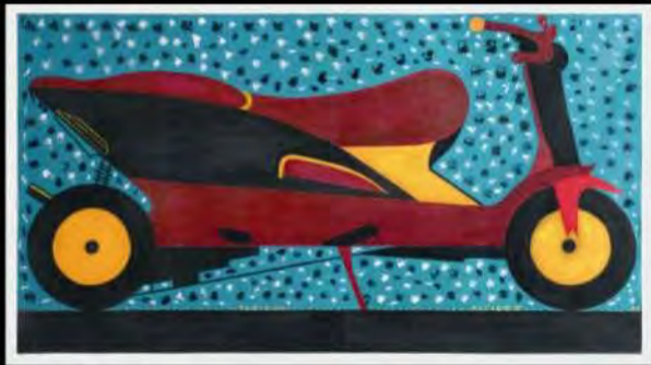
Acrylica s/ tela | Tarlene | 87x152 cm