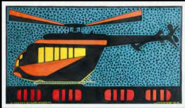
Acrílico s/ tela | A targete enlle sempreira | 87x154 cm