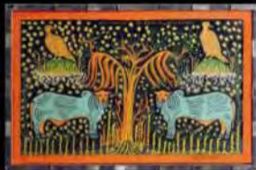
Acrílico s/ tela | Os bois e as pãssaros | 55x69 cm