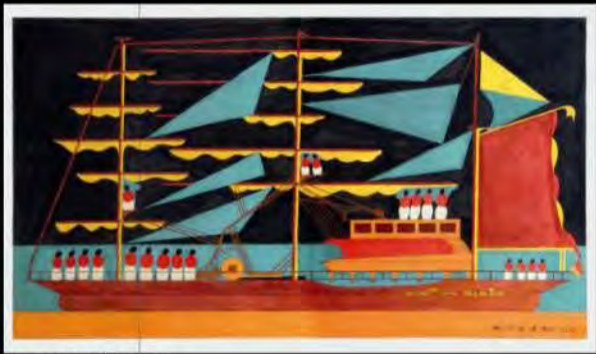
Acrílico s/ tela | Navio da Glóbia | 86x150 cm