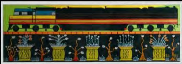
Acrílico s/ tela | Sem título | 76x222 cm