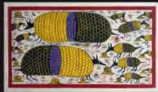
Acrílico s/ tela | Tábua | 49x64 cm