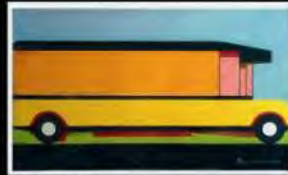
Arquitetura Brasileira | Museu de Arte e Cultura Popular