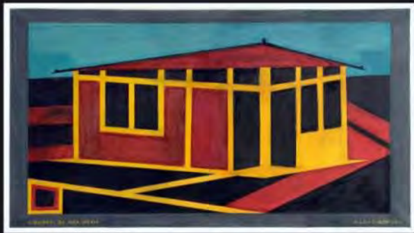
Acrílico s/ tela | O balcão de Vila Sônia | 87x156 cm