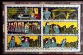
Acrílico s/ tela | A Mãe | 56x62 cm