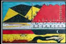
Arquitetura Brasileira | Promove | Curitiba

1987 - Curitiba - Museu de Arte e Cultura Popular - Curitiba - 1979